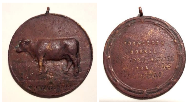
Foto 6. De 1 e prijs-medaille van Bertha 2, met opschrift: Fokveedag Boekel 1 Pr. No 37879 KS 1946 Bertha 2.

En op maandagmorgen 30 september 2019 werd-ie, na zo'n 70 jaar op het land gelegen te hebben, weer teruggeven aan de toenmalige en inmiddels 105-jarige mede-eigenaar van Bertha 2.