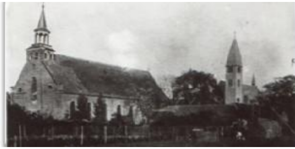
Twee kerken op een foto in 1925. De funderingen van de oude Waterstaatkerk zijn nog te zien op het Agatha-plein.

Mijn opa was maar een klein boertje die in de jaren twintig nog voer met een koe als trekdier. De prijs van het pachten was opgelopen naar 100 gulden geboden door Hein Aldenhuijsen. Een zeer hoog bedrag.