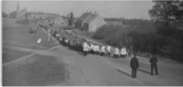
Foto genomen vanaf de splitsing Rutger van Herpenstraat - Donkstraat. Processie voor de vruchten der aarde in de twintiger jaren. Pastoor de Raad laat de stoet keren terug richting kerk. De beide veldwachters regelen het verkeer! Links onderaan ligt een pad dat later de Burgemeester Schafratstraat zou worden. De hele linkerkant van de Rutger van Herpenstraat is onbebouwd tot brouwerij van de Burgt., klooster en kerk.

Dan speelde de harmonie op de kiosk en wandelden de jongelui door de straat. De processie voor de Vruchten der Aarde werd gehouden op 12, 13 en 14 mei, de z.g. ijsheiligen. Na de mis van 8 uur mis trok de processie al biddend en zingend drie dagen naar drie verschillende kanten van het dorp. "Een dag gingen ze naar het Kruis en draaiden daar dan om. Dat was ter hoogte van nu de Burgemeester Schafratstraat en d'r stonden 2 veldwachters, om het verkeer te regelen maar er was nergens verkeer te zien. Een andere route was ook de Kerkstraat, Irenestraat en Buskensstraat. De derde route ging door de Burgtstraat, via de Beatrixlaan en Julianastraat". Vanaf 1917 ging er een processie naar Handel. Bij ernstige ziekten ging men ook wel over de "Keskesdijk" bidden. Verder was er de processie naar Haekendover, naar Banneux en de voetprocessie naar Kevelaer.